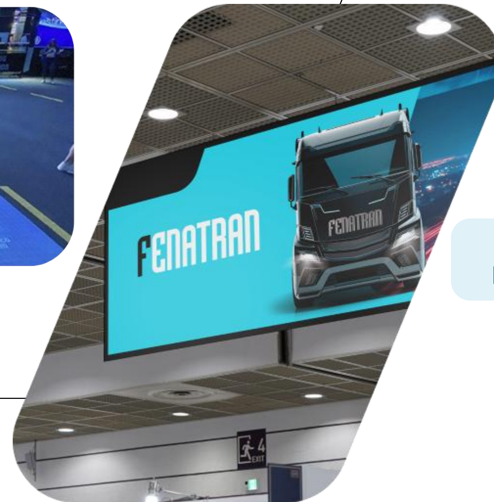
VT de 10" no Painel Aéreo de Led na Rua Principal do Evento