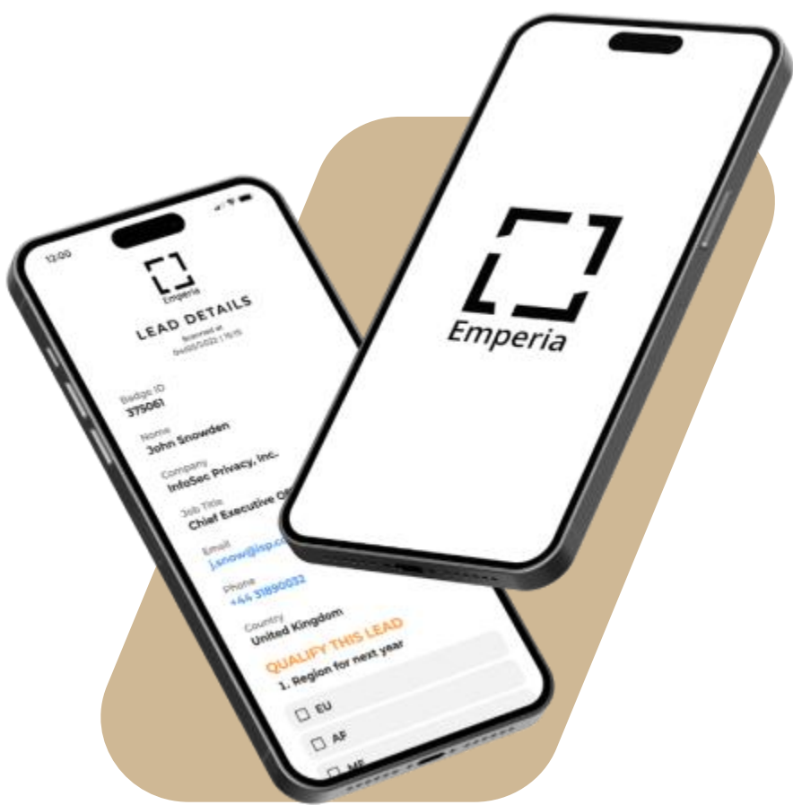
Lead Manager - Captura de Leads